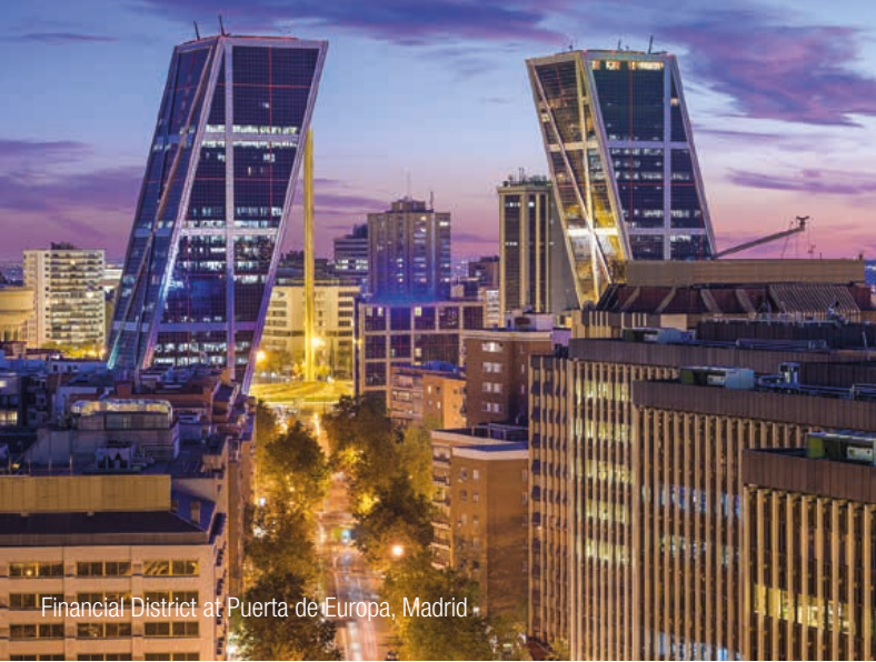
Financial District at Puerta de Europa, Madrid

InterGest Spain was founded 1988 to assist foreign companies in establishing and developing their business activities in Spain.