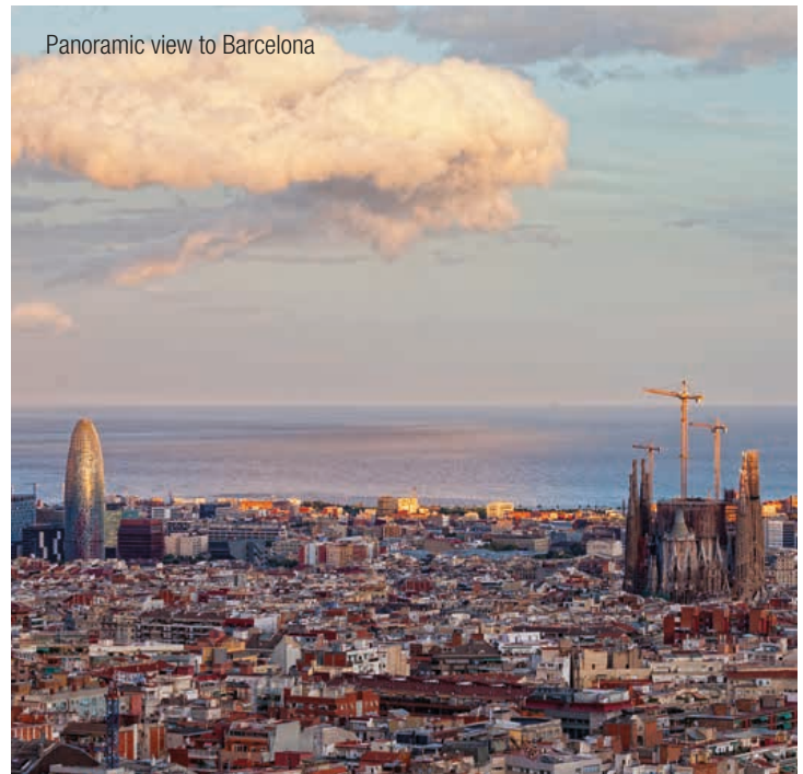
Panoramic view to Barcelona

Our competent InterGest partners will assist you in over 50 countries, from Canada to New Zealand, where a team of around 750 employees currently provides consulting services to approximately 1,700 branches of international companies.